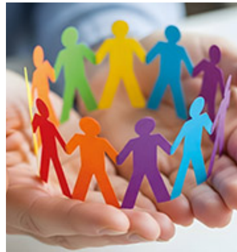
Text wurde mit Unterstützung von KI erstellt

Das klingt formal – und ist es in Teilen auch. Tagesordnungen, Geschäftsordnungen, Abstimmungen. Mitgliederversammlungen können strukturiert und nüchtern wirken. Aber sie sind das Fundament einer demokratischen Organisation. Viele Entwicklungen beginnen nicht mit einem Paukenschlag, sondern mit einem präzise formulierten Antrag. Auf der letzten Regionskonferenz wurde genau das sichtbar. Mehrere Anträge aus Ortsvereinen, die im Regionsrat intensiv beraten – und beschlossen wurden gehen nun ihren Weg in die nächsthöheren Ebenen der AWO.